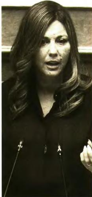
* Η υπουργός Κοινωνικής Συνοχής και Οικογένειας, Σοφία Ζαχαράκη

Π ολύ μεγάλης αποδοχής από την κοινωνία και ζήτησης από ενδιαφερόμενους έτυχε το στεγαστικό πρόγραμμα «Σπίτι μου», σε μια περίοδο που η εξεύρεση φθηνής κατοικίας εξελίσσεται σε τεράστιο «πονοκέφαλο» για τα νοικοκυριά. Και όχι τυχαία, καθώς οι προϋποθέσεις συμμετοχής ήταν ιδιαίτερα ευνοϊκές και η υλοποίησή του ταχύτατη. Μάλιστα, σύμφωνα με στοιχεία που διαβιβάστηκαν στη Βουλή από την υπουργό Κοινωνικής Συνοχής και Οικογένειας, Σοφία Ζαχαράκη, το συνολικό ποσό που έχει εκταμιευθεί για τα δάνεια που έχουν δοθεί στο πλαίσιο του προγράμματος «Σπίτι μου» ανέρχεται -μέχρι στιγμής- στα 246.800.000 ευρώ.