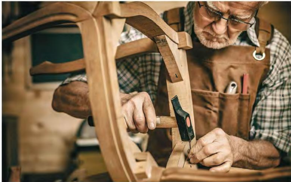
Η τρέχουσα ηλικία συνταξιοδότησης είναι τα 65 χρόνια στις περισσότερες ευρωπαϊκές χώρες, αν και έχει αυξηθεί η προσδοκώμενη ζωή εκτός εργασίας.

Το μοντέλο αυτό έχει ήδη υιοθετηθεί εκτός από την Ελλάδα, στην Ολλανδία, τη Σουηδία και τη Φινλανδία. Στόχος είναι να υπάρξει ένας σταθερός λόγος συνταξιοδότησης/εργαζομένων παρά τη γήραση του πληθυσμού. Την πρόταση προωθεί ο Γιάκκιμ Ράινιτς, ειδικός σε θέματα συνταξιοδότησης στο Ινστιτούτο Ifo.