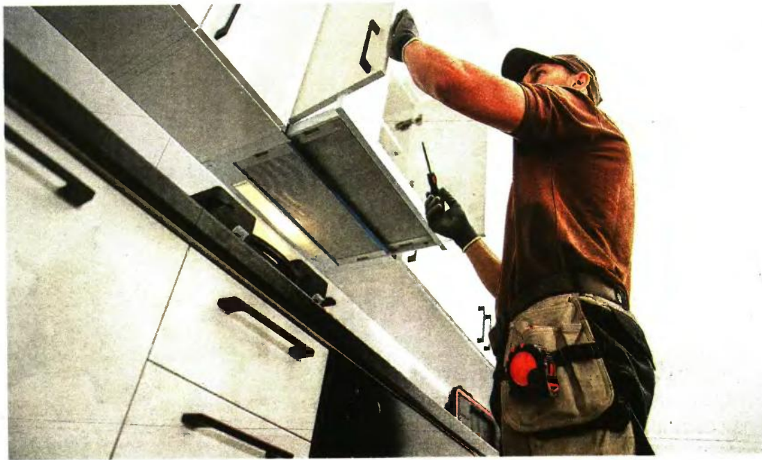
Το πρόγραμμα «Ανακαινίζω-Νοικιάζω» αφορά κατοικίες έως 100 τ.μ. σε αστικά κέντρα και θα ξεκινήσει εντός Ιανουαρίου.

Μέσω του προγράμματος εκτιμάται ότι μπορεί να ωφεληθούν από 12.500 έως και 25.000 ιδιοκτήτες