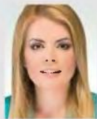
Γράφει η Κατερίνα Φραγκάκη

Το δημογραφικό πρόβλημα της Ελλάδας είναι αποτέλεσμα της οικονομικής κρίσης, της έλλειψης ουσιαστών κινήτρων και βοηθημάτων στους γονείς, της αύξησης των διαζυγίων, αλλά και της έλλειψης ενημέρωσης των νέων για τα ζητήματα γονιμότητας. Οι νέες και οι νέοι δίνουν έμφαση σε άλλες προτεραιότητες και όχι στη δημιουργία οικογένειας, καθώς