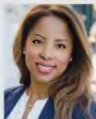
Γράφει η Αγγελική Λεβέντη

Είναι άμεσα συνδεδεμένο με διλήμματα που προκύπτουν από την καθημερινότητα και τις υποχρεώσεις των πολιτών, τις επαγγελματικές συνθήκες και, φυσικά, την πορεία της οικονομίας και την κοινωνική πολιτική που εφαρμόζει η εκάστοτε κυβέρνηση.