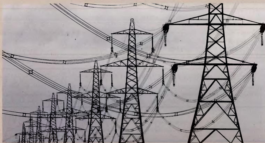
Τον δρόμο του ανταγωνισμού στα μπλε τιμολόγια άνοιξε η ΔΕΗ, αναπροσαρμόζοντας την τιμή της κλοβατώρας από τα 28 λεπτά και 29,5 λεπτά στα δύο σταθερά της τιμολόγια στα 17,9 λεπτά, μόλις 2 λεπτά υψηλότερα από την αρχική τιμή χρέωσης της κλοβατώρας στο πράσινο τιμολόγιό της.

Μεγάλοι και μικροί ιδιώτες πάροχοι κλείνουν πακέτα αντιστάθμισης στις προθεσμιακές αγορές, που θα τους επιτρέψουν να διαμορφώσουν χαμηλές τιμές για τα σταθερά τους τιμολόγια, τα οποία απ' ό, τι φαίνεται θα αποτελέσουν την προμετωπίδα της μάχης για τη διατήρηση των μεριδίων τους στη λιανική αγορά στη μετα-επιδότησεων εποχή, που ξεκινάει από τις αρχές του νέου έτους. Η μπλε κλοβατώρα με βάση την εικόνα που διαμορφώνεται μέχρι αυτή τη στιγμή από την αγορά θα είναι τον Ια-