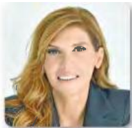
γράφει η ΚΑΤΙΑ ΜΑΚΡΗ

ΟΙ ΠΟΛΙΤΕΣ ακούν τις τελευταίες ημέρες ευλαβικά τις συνεντεύξεις του υπουργού Περιβάλλοντος και Ενέργειας Θόδωρου Σκυλακάκη για τα χρωματιστά τιμολόγια ρεύματος. Οχι για τη ρητορική του δεινότητα, αυτό το ξέρει και ο ίδιος ο υπουργός. Από αγωνία τον ακούν, γιατί προσπαθούν να ξεπερδέψουν τον μίζο και να καταλάβουν σε ποιο κρύμα της εικαστικής του παλέτας πρέπει να ποντάρουν.