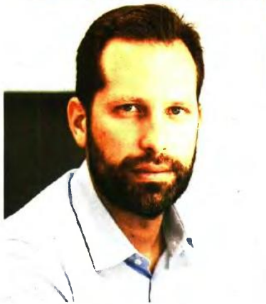
Ο γενικός γραμματέας Κοινωνικής Ασφάλισης Νίκος Μνλαθιάδης

Οι αφελούμενοι από το μίνι Ασφαλιστικό Ξεπερνούν το 1 εκατομμύριο. Από αυτούς 742.772 είναι συνταξιούχοι που θα λάβουν το επίδομα προσωπικής διαφοράς στις 21 Δεκεμβρίου, 100.000 συνταξιούχοι με αναπηρία που θα μπορούν να εργάζονται χωρίς τις αυστηρές προϋποθέσεις του παρελθόντος, 10.000 οφειλότες του ΕΦΚΑ για τους οποίους θα ξεμπλοκαριστεί η διαδικασία συνταξιοδότησής τους και 13.000 εν αναμονή δικαιούχοι της επικουρικής σύνταξης που θα λάβουν άμεσα τις συντάξεις τους