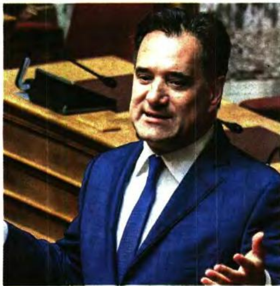
Το ασφαλιστικό νομοσχέδιο κατέθεσε στη Βουλή ο υπουργός Εργασίας, Αδωνīs Γεωργιάδης, ενώ ταυτόχρονα υπέγραψε και την απόφαση για την αύξηση κατά 3% που θα πάρουν οι συνταξιούχοι από το 2024.

Θα λάβουν το 7,75% για το 2023 και 3% για το 2024 αλλά στο 50% της σύνταξης