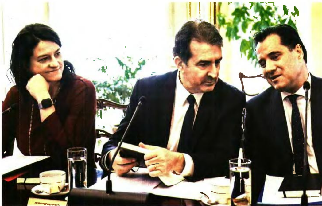
* Οι συναρμόδιοι υπουργοί Εσωτερικών, Νίκη Κεραμέως, Υγείας, Μιχάλης Χρυσοχοϊδης, και Εργασίας, Άδωνις Γεωργιάδης

Αντίστοιχα, παρατείνεται από τη λήξη της έως και την 31η/3/2024 η σύμβαση όσον απασχολούνται για τη λειτουργία εμβολιαστικών κέντρων, των παιδιάτρων ως οικογενειακών ιατρών, των συμβεβλημένων ιατρών του ΕΟΠΥΥ, των εργαζομένων σε κλειστές δομές κοινωνικής φροντίδας για ηλικιωμένους, προ-