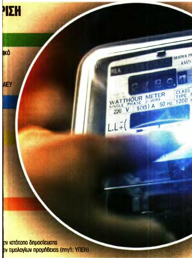
εν ιστότοπο δημοσιεύσης εν τιμολογίων προμήθειας