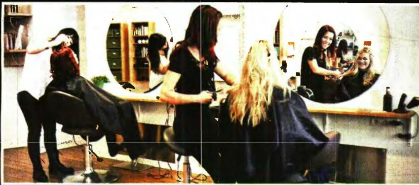
Το νέο καθεστώς φορολόγησης των νέων επαγγελματιών ξεκαθαρίζει ο οδηγός του υπ. Οικονομικών.

7.098€ (14.196€ με μείωση 50% λόγω μονογονεϊκής οικογένειας) και ο φόρος της σε 639€ (-628€). Ειδικά για το φορολογικό έτος 2023, πέραν του φόρου θα έχει την υποχρέωση καταβολής νέου τέλους επιτεύματος ύψους 325€ (-303€) το οποίο και καταργείται πλήρως από το 2025 και μετά. Επομένως, στη συγκεκριμένη περίπτωση η συνολική φορολογική επιβάρυνση θα είναι μικρότερη από αυτή που ισχύει σήμερα.