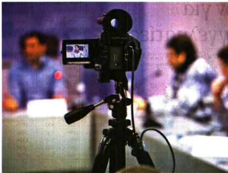
Το οπτικοακουστικό υλικό από την καταγραφή των ελέγχων της ΑΑΔΕ θα φυλάσσεται για έξι μήνες.

Ειδικότερα, οι έμμεσες τεχνικές, που βασίζονται σε στοιχεία όπως οι τραπεζικές καταθέσεις, οι δαπάνες σε μετρητά, η ρευστότητα του φορολογούμενου κ.ά., επεκτείνονται πλέον για τον προσδιορισμό των εισοδημάτων και σε τρεις ακόμη περιπτώσεις, πέρα φυσικά από αυτές που ισχύουν ήδη, οι οποίες είναι οι εξής: ● Όταν δηλώνεται ζημία σε τρία τουλάχιστον συνεχόμενα έτη και δεν προκύπτει ο τρόπος χρημα-