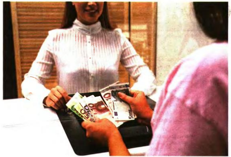
Το πρόστιμο για αγορές αξίας πάνω από 500 ευρώ με μετρητά, το οποίο σήμερα είναι 100 ευρώ, διαμορφώνεται στο διπλάσιο της αξίας της απόδειξης.