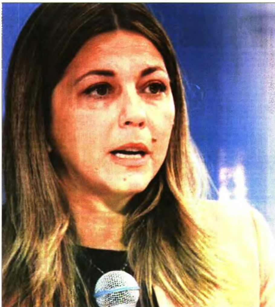
Αγαπητή Σοφία δεν χρειαζόμαστε ρεπορτάζ για το δημογραφικό. Από σένα θέλουμε φροντίδα και μέτρα υπέρ της ελληνικής οικογένειας και του δημογραφικού! Με τις πορδές δεν βάφονται αυγά!!!

Στη πρόσφατη συνεδρίαση της Επιτροπής Περιφερειών με θέμα το δημογραφικό η Σοφία Ζαχαράκη τόνισε πως "τα επίπεδα γονιμότητας στην Ελλάδα είναι από τα χαμηλότερα παγκοσμίως, ενώ πέφτει ο μέσος όρος κτήσης παιδιών ανά γυναίκα". Μπα! Τι μας λέει; Μα περιμέναμε τη Ζαχαράκη για να το μάθουμε; όταν βόα όλη η χώρα για την ερήμωσή της; Αυτά είναι έργα των ειδικών επιστημόνων της ΕΛΣΤΑΤ, των ρεπόρτερ και των ερευνητών, δεν περιμέναμε την υπουργό να μας ενημερώσει! Και γιατί τα είπε στους εκπροσώπους των Περιφερειών; Το καλύτερο που είχε και έχει είναι να τα πει στον σύμβουλο του Πρωθυπουργού Αλέξη Πατέλη, που εκβιάζει τον Μητσικόδη πως θα παραιτηθεί (σκασιλα μας) αν δεν ψηφίσει το νομοσχέδιο για τον γάμο και την υιοθεσία παιδιών από τους ΛΟΑΤ-ΚΙ+! Και τι θα κάνει ως αρμόδια υπουργός αν αναγκαστεί η ίδια να φέρει το νομοσχέδιο αυτό στη Βουλή; Με το γάμο των γκέι θα αυγατίσουν τα παιδιά στη Θράκη; Και πως θα αυξηθεί το επίπεδο της γονιμότητας αν τα ζευγάρια των γκέι, που βεβαίως δεν τεκνοποιούν, υιοθετούν από τα λίγα παιδιά που θα κυοφορούν οι γυναίκες; Βεβαίως θα ικανοποιηθεί το βασικό αίτημα των ομοφυλοφίλων αλλά με ξένα κόλλυβα θα κάνουν μνημόσυνο!