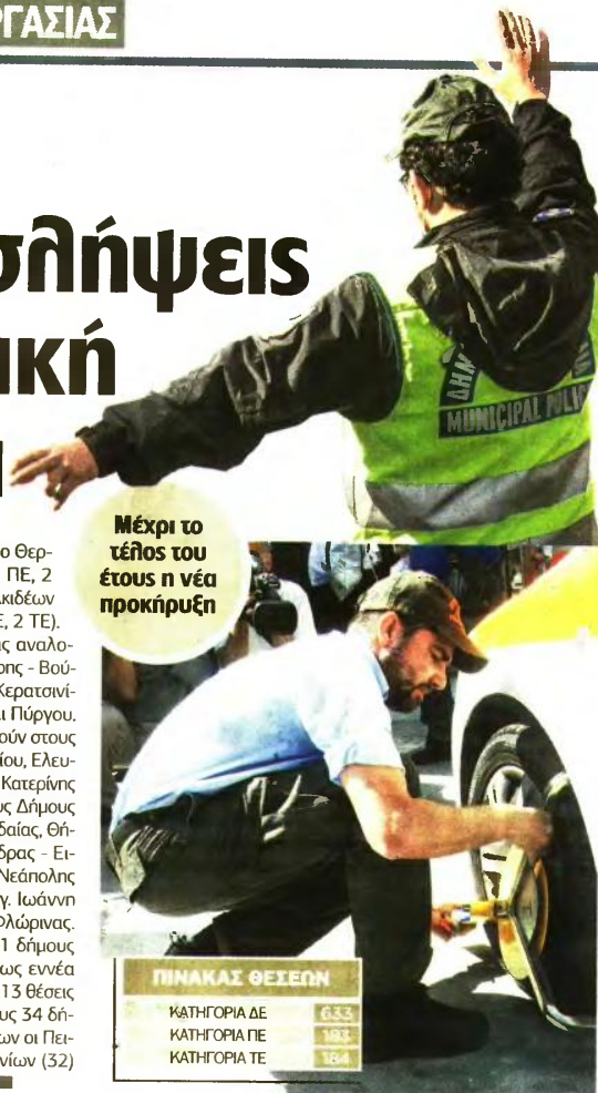
Μέχρι το τέλος του έτους η νέα προκήρυξη

2 ΠΕ, 2 ΤΕ), στον Δήμο Θερμαϊκού 15 (11 ΔΕ, 2 ΠΕ, 2 ΤΕ) και στον Δήμο Χαλκιδέων 13 θέσεις (9 ΔΕ, 2 ΠΕ, 2 ΤΕ). Επίσης, από 12 θέσεις αναλογούν στους Δήμους Βάρης - Βούλας - Βουλιαγμένης, Κερατσίνου - Δραπετσώνας και Πύργου. Εντεκα θέσεις αναλογούν στους Δήμους Αγίου Δημητρίου, Ελευσίνας, Κασσάνδρας και Κατερίνης και από 10 θέσεις στους Δήμους Αγρινίου, Δράμας, Εορδαίας, Θήρας, Κομοτηνής, Μάνδρας - Ειδυλλίας, Ναυπακτίας, Νεάπολης - Συκεών, Νίκαιας - Αγ. Ιωάννη Ρέντη, Ρεθύμνης και Φλώρινας. Στους υπόλοιπους 111 δήμους αναλογούν από μία έως εννέα θέσεις. Αντίστοιχα, οι 213 θέσεις κατανομούνται σε άλλους 34 δήμους, μεταξύ των οποίων οι Πειραιώς (77 θέσεις), Χαλίων (32) και Καλαμαριάς (15). ■