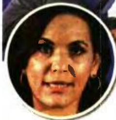
* Ο Κυριάκος Μητσοτάκης στο συνέδριο για τον τουρισμό, αριστερά, η υπουργός Τουρισμού, Όλγα Κεφαλογιάννη

κοινωνίας και φυσικά απασχόληση. Επιπλέον, μίλησε για τις προσπάθειες που έχουν γίνει για το «πρασίνισμα» των νησιών, τις υποδομές, τις μετακινήσεις, ζητήματα καθαριότητας και άλλα παραδείγματα διαχείρισης. «Το ΑΕΠ και οι επενδύσεις θα είναι το τελικό προϊόν που θα προσθέσει στη συνολική αλλαγή του brand της χώρας», τόνισε και συμπλήρωσε πως «από την πολιτική σταθερότητα έως την οικονομική ανάπτυξη, είναι αυτές