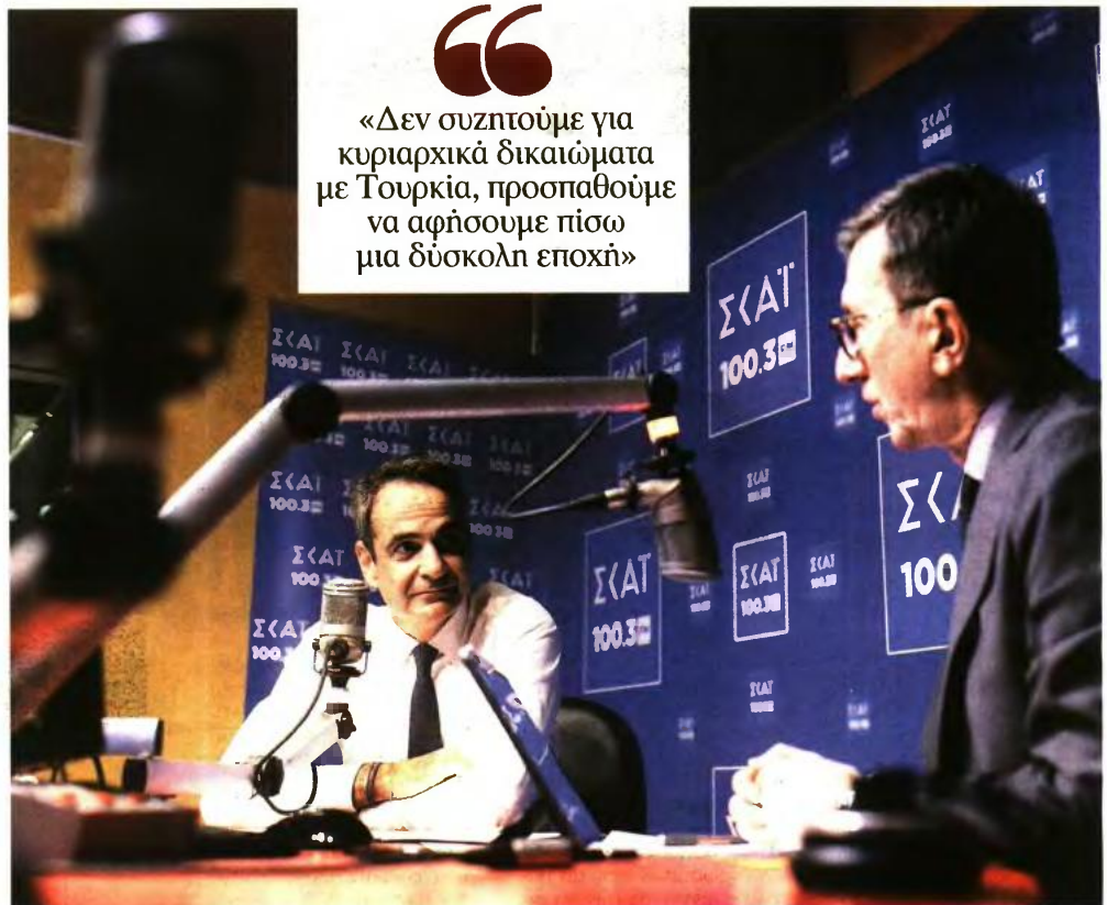
* Ο Κυριάκος Μητσοτάκης έδωσε χθες ραδιοφωνική συνέντευξη στον Σκάι και τον δημοσιογράφο Άρη Πορτοσάλτε

Μάλιστα αναφέρθηκε ερωτήσιες σχετικές και στους εντατικούς ελέγχους στην αγορά αλλά και στα πρόστιμα που επιβάλλονται εσχάτως, ακόμη και σε πολυεθνικούς κολοσσούς. «Θέλουμε κανόνες ανταγωνισμού δικαίους, θέλουμε την αγορά να λειτουργεί, αλλά δεν θα βγάλουν κάποιον στην πλάτη του Έλληνα καταναλωτή χρήματα τα οποία δεν δικαιολο-