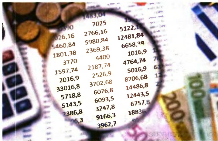
Όπου διαπιστώνονται παραβάσεις μέσω του «Συστήματος Αυτοματοποιημένου Ελέγχου Προσαύξησης Περιουσίας», θα δίνεται άμεσα εντολή για άρση του τραπεζικού και επαγγελματικού απορρήτου των ελεγχόμενων.

ΤΟ ΠΡΑΞΙΝΟ ΦΩΣ έδωσε χθες ο διοικητής της Ανεξάρτητης Αρχής Δημοσίων Εσόδων (ΑΑΔΕ), με απόφαση του οποίου ερρίφθη ο κύβος για την ενεργοποίηση και λειτουργία του «Συστήματος Αυτοματοποιημένου Ελέγχου Προσαύξησης Περιουσίας», το οποίο στην περίπτωση που διαπιστωθούν παραβάσεις θα δίνει αμέσως εντολή για άρση του τραπεζικού και επαγγελματικού απορρήτου των ελεγχόμενων. Το εν λόγω σύστημα, σύμφωνα και με τη σχετική απόφαση (υπ' αριθμ. Α1179/15.11.2023), θα αξιοποιεί όλα τα δεδομένα του Αρχείου Χρηματοπιστωτικών Προϊόντων και Αναλυτικών Χρηματοπιστωτικών Συναλλαγών. Στόχος του θα είναι η ταχεία λήψη και επεξεργασία στοιχείων και πληροφοριών που αφορούν ελεγχόμενα πρόσωπα, κατά τρόπο τυποποιημένο και ενιαίο, προκειμένου να καταστεί ταχύτερος και αποτελεσματικότερος ο προσδιορισμός της φορολογητέας ύλης και συνεπώς αποτελεσματικότερη και αποδοτικότερη η φορολογική ελεγκτική διαδικασία, με τελικό σκοπό την περιστολή της φοροδιαφυγής.