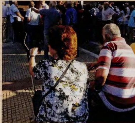
Για μία ακόμη χρονιά κυκλοφορεί η φήμη ότι αν κάποιος βγει στη σύνταξη το επόμενο έτος θα τη λάβει μειωμένη σε σχέση με το αν «προλάβει» να συνταξιοδοτηθεί φέτος. Από την πλευρά τους ειδικοί της κοινωνικής ασφάλισης τονίζουν στην «Κ» ότι δεν υπάρχει κανένας λόγος βιασύνης.

Όπως είναι γνωστό, η σύνταξη αποτελείται από δύο τμήματα. Την εθνική και την ανταποδοτική. Η εθνική ορίστηκε κατ' αρχάς στα 384 ευρώ (για 20 έτη ασφάλισης) και προβλέφθηκε να αναπροσαρμόζεται κατ' έτος, σύμφωνα με όσα προβλέπονται για την αναπροσαρμογή των συντάξεων, δηλαδή με βάση τον συντελεστή που προκύπτει από το άθροισμα του ετήσιου ποσοστού μεταβολής του ΑΕΠ, συν το ποσοστό μετα-