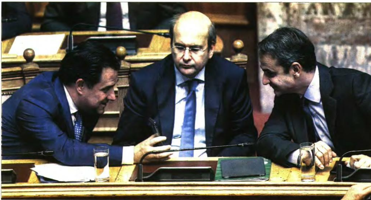
Από αριστερά: Αδωνīs Γεωργιάδης, Κωστής Χατζηδόσης και Κυριάκος Μητσοτάκης στη Βουλή

Ψ ηλά στην κυβερνητική ατζέντα βρίσκεται η προεκλογική υπόσχεση για τον μέσο μισθό στη χώρα μας, που, με βάση τις εξαγγελίες, θα φτάσει στο τέλος της τετραετίας στα 1.500 ευρώ, από τα σχεδόν 1.200 ευρώ (μεικτά) σήμερα. Πρόκειται για μία δέσμευση που με τα σημερινά δεδομένα θα πρέπει να θεωρηθεί ιδιαίτερα αισιόδοξη, καθώς τα δεδομένα της αγοράς δεν επιτρέπουν την επίτευξη αυτού του στόχου. Αξίζει να σημειωθεί πως η αύξηση του μέσου μισθού στα 1.500 ευρώ δεν θα προέλθει με κάποια νομοθετική ρύθμιση της κυβέρνησης τα επόμενα χρόνια, αλλά από την ίδια την πορεία της αγοράς. Με άλλα λόγια, το οικονομικό επιτελείο θεωρεί πως οι ίδιες επιχειρήσεις θα αποφασίσουν από μόνες τους να αυξήσουν τους μισθούς των εργαζομένων τους σε αυτά τα επίπεδα μέχρι το τέλος της τετραετίας της διακυβέρνη-