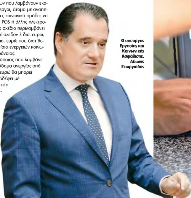
Ο υπουργός Εργασίας και Κοινωνικής Ασφάλισης, Άθωνας Γεωργιάδης