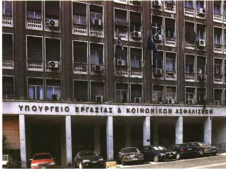
Μετά το νομοσχέδιο για τα ΤΕΑ θα έρθει νομοσχέδιο για τα επιδόματα του ΕΦΚΑ.

Για το ποσό από 20.000 ευρώ έως 30.000 ευρώ (6.000 ευρώ έως 10.000 ευρώ για τον π. ΟΓΑ) παρακρατείται ποσοστό τουλάχιστον 60% της μηνιαίας σύνταξης, ενώ για το υπόλοιπο χρέος γίνεται παρακράτηση σε 60 δόσεις μέχρι την εξόφλησή του, όπως γίνεται και σήμερα. Ως κριτήριο υπαγωγής στη ρύθμιση τίθεται όριο τραπεζικών καταθέσεων του οφειλέτη στα 12.000