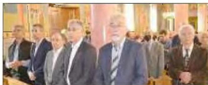
Στιγμιότυπα από τις εκδηλώσεις

Τ ην Ημέρα της Πολύτεκνης Οικογένειας, κατά την οποία τιμάται η μνήμη των Προστατών του Αγίου Μαρτύρων Τερεντίου, Νεονίλλης και των επτά τέκνων τους, γιόρτασε την Κυριακή, με την προσήκουσα λαμπρότητα, ο Σύλλογος Πολυτέκνων Γονέων Νομού Τρικάλων. Το πρωί ετελέσθη Θεία Λειτουργία μετ' αρτοκλασίας στον Ι.Ν. Αγίου Αθανασίου Μπάρας ιερουργούντος τού (Τρικαλινής καταγωγής) Επισκόπου Στρατονικείας κ. Στε-