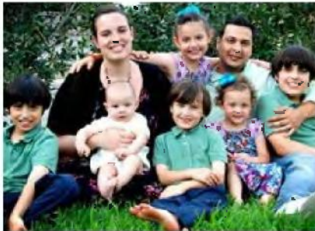
Την Κυριακή στον Αγ. Σπυρίδωνα

ΤΗΝ ΚΥΡΙΑΚΗ 12/11 ΣΤΟΝ ΑΓΙΟ ΣΠΥΡΙΔΩΝΑ ΚΩΤΣΕΛΑ