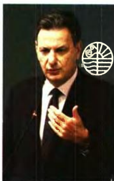
«Αυτοί που θερμαίνονται με ηλεκτρικό είναι πλέον οι μισοί καταναλωτές» σημείωσε ο υπουργός Θόδωρος Σκυλακάκης.

Εξηγώντας τη λογική του νέου «επίδοματος θέρμανσης», ο υπουργός Θόδωρος Σκυλακάκης σημείωσε πως «αυτοί που θερμαίνονται με ηλεκτρικό είναι πλέον οι μισοί καταναλωτές». Δικαιούχοι είναι όσοι καλύπτουν τα εισοδηματικά και περιουσιακά κριτήρια για το επίδομα θέρμανσης. Θα εξαιρούνται οι δικαιούχοι Κοινωνικού Οικιακού Τιμολογίου (που θα συνεχίσουν να σπηρίζονται μέσω του εν λόγω επιδοτούμενου τιμολογίου) και