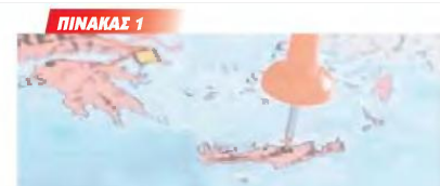
ΓΕΝΝΗΣΕΙΣ, ΘΑΝΑΤΟΙ και φυσική μεταβολή του πληθυσμού κατά μέσο όρο το χρόνο στους νομούς Ηρακλείου, Λασιθίου, Ρεθύμνης και Χανίων

Η μεγαλύτερη μείωση των γεννήσεων σημειώθηκε στους νομούς Ηρακλείου και Λασιθίου και η μικρότερη στο νομό Χανίων. Η μεγαλύτερη αύξηση των θανάτων σημειώθηκε στο νομό Ηρακλείου και η μικρότερη στο νομό Ρεθύμνης. Στους νομούς Ρεθύμνης, Ηρακλείου και Χανίων σημειώθηκε φυσική αύξηση του πληθυσμού, δηλαδή οι γεννήσεις ξεπεράσαν τους θανάτους και τις δύο περιόδους. Τη δεύτερη, όμως, περίοδο η φυσική αύξηση ήταν πολύ μικρότερη. Η μικρότερη μείωση της φυσικής αύξησης (βλέπε την 3 η στήλη της τελευταίας σειράς στο κάθε νομό)