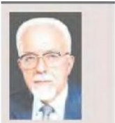
Του Μανώλη Γ. Δρεττάκη*

Την 26.10.23 η Ελληνική Στατιστική Αρχή (ΕΛΣΤΑΤ) έδωσε στη δημοσιότητα τα οριστικά στοιχεία για