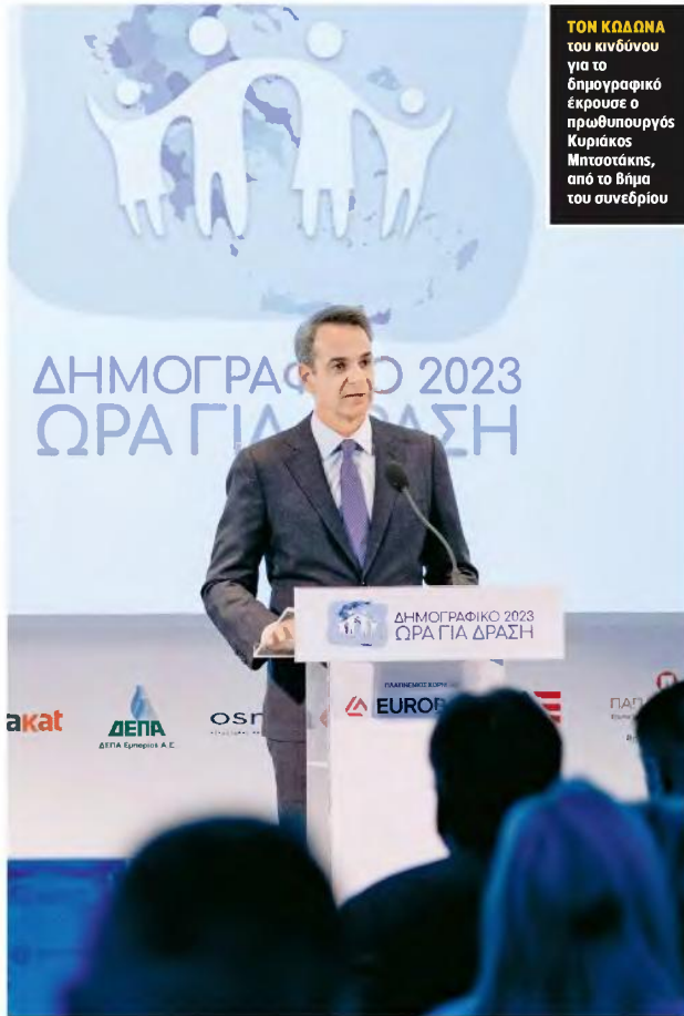
ΤΟΝ ΚΩΔΩΝΑ του κινδύνου για το δημογραφικό έκρουσε ο πρωθυπουργός Κυριάκος Μητσοτάκης, από το βήμα του συνεδρίου

Στις δράσεις που θα αναλάβει το υπουργείο για την αντιμετώπιση του δημογραφικού αναφέρθηκε η υπουργός Κοινωνικής Συνοχής και Οικογένειας Σοφία Ζαχαράκη, στη συνέντευξη που παραχώρησε στον εκδότη και διευθυντή της «R». «Το εθνικό μας σχέδιο δράσης θα πρέπει να