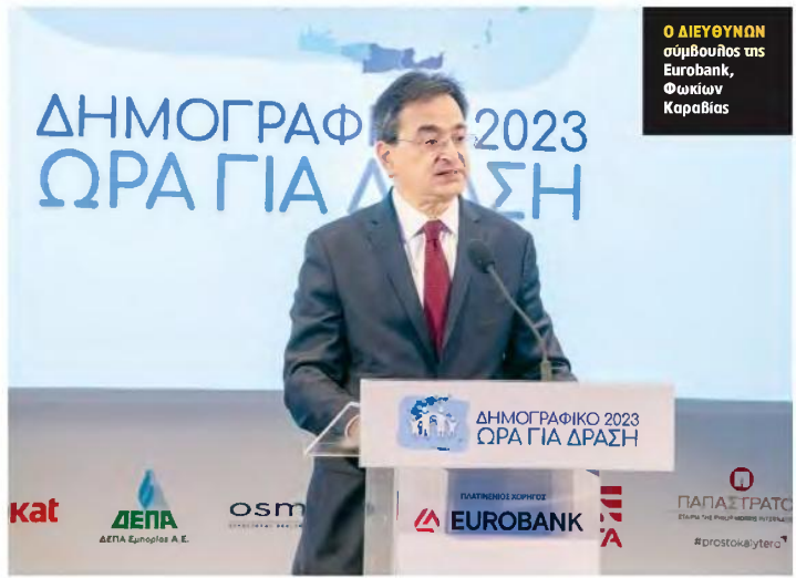
Ο ΔΙΕΥΘΥΝΩΝ σύμβουλος της Eurobank, Φωκίων Καραβίας

Πολύχρονη προσπάθεια που προϋποθέτει πολλούς συμμάχους χαρακτήρισε τον αγώνα για την αντιμετώπιση της δημογραφικής κρίσης ο πρωθυπουργός Κυριάκος Μητσοτάκης από το συνέδριο «Δημογραφικό 2023 - Ωρα για δράση»