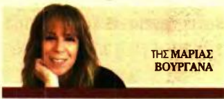
THE MARIAS BOYRGANA

Αλγόριθμος θα προσδιορίζει τα ελάχιστα εισοδήματα που θα πρέπει να δηλώνουν στην Εφορία οι επαγγελματίες ■ Όλες οι αλλαγές