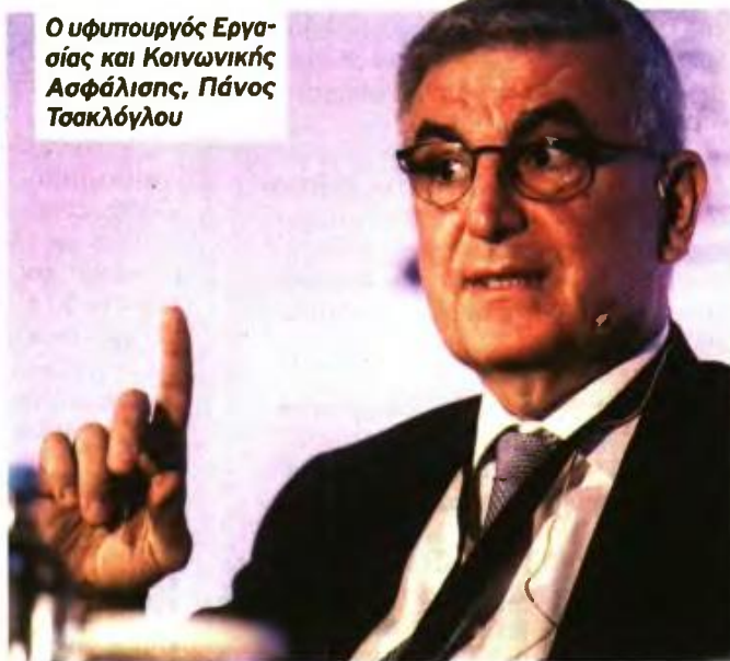
Ο υφυπουργός Εργασίας και Κοινωνικής Ασφάλισης, Πάνος Τσακλόγλου

του ορίου συνταξιοδότησης τα αμέσως επόμενα χρόνια», όπως ανέφερε χαρακτηριστικά, χωρίς να αποκλείει το ενδεχόμενο «αναμφίβολα κάποια στιγμή να γίνει και αυτό».