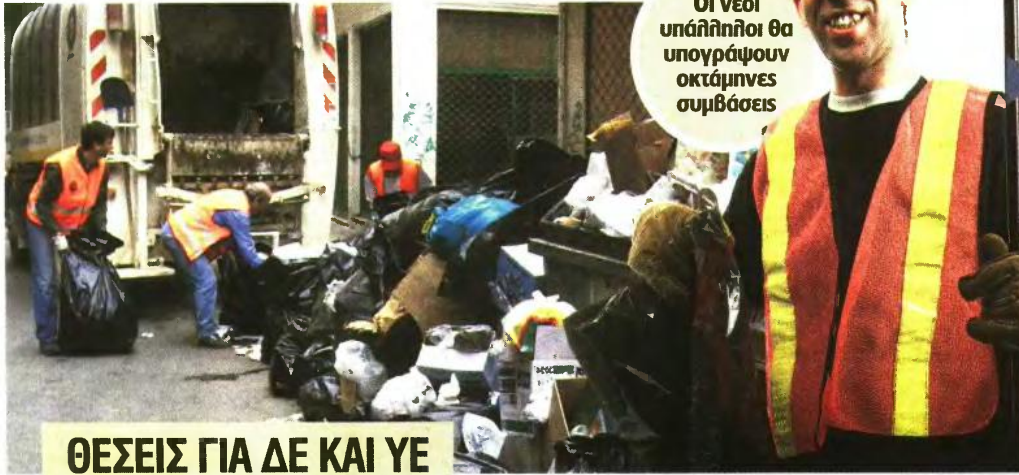
ΘΕΣΕΙΣ ΓΙΑ ΔΕ ΚΑΙ ΥΕ