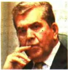
Του Αλέξη Π. Μητρόπουλου *

Ο ι πολιτικές κατά των γεννήσεων, της οικογένειας και των γυναικών, αλλά και οι εξοντωτικές και διαρκείς περικοπές των συντάξεων, που εφήρμισαν οι δανειστές και τα τρία μνημονιακά κόμματα εξουσίας (ΝΔ, ΣΥΡΙΖΑ, ΠΑΣΟΚ) σε αριθμούς, παραπέμπουν σε συνθήκες πολέμου ή πολιτικές εθνικής γενοκτονίας!