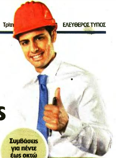
Συμβάσεις για πέντε έως οκτώ μήνες

Παράλληλα, για οκτώ μήνες θα απασχοληθούν 136 υπάλληλοι στον Οργανισμό Διαχείρισης Πολιτιστικών Πόρων. Οι θέσεις είναι: 1 ΠΕ Πληροφορικής (software ή hardware), 1 ΠΕ Αρχιτεκτόνων Μηχανικών, 1 ΠΕ Πολιτικών Μηχανικών, 2 ΠΕ Τοπογράφων Μηχανικών, 2 ΠΕ Καλών Τεχνών (γλυπτών), 3 ΠΕ Καλών Τεχνών (ζωγράφων), 1 ΠΕ Πολιτιστικής Διαχείρισης, 5 ΠΕ Διοικητικού-Οικονομικού, 7 ΠΕ Οικονομικού, 1 ΤΕ Ηλεκτρολόγων Μηχανικών, 1 ΤΕ Πληροφορικής (software ή hardware), 3 ΤΕ Γραφικών Τεχνών, 9 ΤΕ Λογιστικού, 6 ΤΕ Συντηρητών Αρχαιοτήτων & Εργων Τέχνης (ειδίκευση λίκου), 6 ΔΕ Συντηρητών Αρχαιοτήτων & Εργων Τέχνης, 84 ΔΕ Πωλησών και 3 ΥΕ Εργατών Γενικών Καθηκόντων. Οι ενδιαφερόμενοι καλούνται να συμπληρώσουν την αίτηση με κωδικό, κατά περίπτωση, ΕΝΤΥΠΟ ΑΣΕΠ ΣΟΧ 1ΠΕ/ΤΕ ή ΕΝΤΥΠΟ ΑΣΕΠ ΣΟΧ 2ΔΕ/ΥΕ και να την υποβάλουν μαζί με τα απαιτούμενα δικαιολογητικά είτε αυτοπροσώπως είτε με άλλο εξουσιοδοτημένο από αυτούς πρόσωπο, εφόσον η εξουσιοδότηση φέρει την υπογραφή τους θεωρημένη από δημόσια Αρχή, στο Πρωτόκολλο της υπηρεσίας κατά τις εργάσιμες ημέρες (από 09:00 π.μ. έως 13:00), είτε ταχυδρομικά με συστημένη επιστολή στα γραφεία της υπηρεσίας στην ακόλουθη διεύθυνση: ΟΡΓΑΝΙΣΜΟΣ ΔΙΑΧΕΙΡΙΣΗΣ & ΑΝΑΠΤΥΞΗΣ ΠΟΛΙΤΙΣΤΙΚΩΝ ΠΟΡΩΝ, ΕΛ. ΒΕΝΙΖΕΛΟΥ 57, Τ.Κ. 10564 - ΑΘΗΝΑ (3ος όροφος), απευθυνώντας την στο Τμήμα Προσωπικού, με την αναφορά ότι πρόκειται για την αίτηση υποψηφιότητας για τη ΣΟΧ 2/2023 (τηλ. επικοινωνίας: 210-3722550-579-580). Οι αιτήσεις λήγουν στις 23 Οκτωβρίου. ■