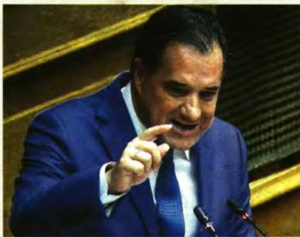
Με διάταξη νόμου του υπουργού Εργασίας, Αδωνη Γεωργιάδη, επανέρχονται οι προσαυξήσεις λόγω προϋπηρεσίας.

Οι μισθωτοί αυτής της κατηγορίας θα λάβουν 10% ως 30% προσαύξηση μισθού, εφόσον μέσα