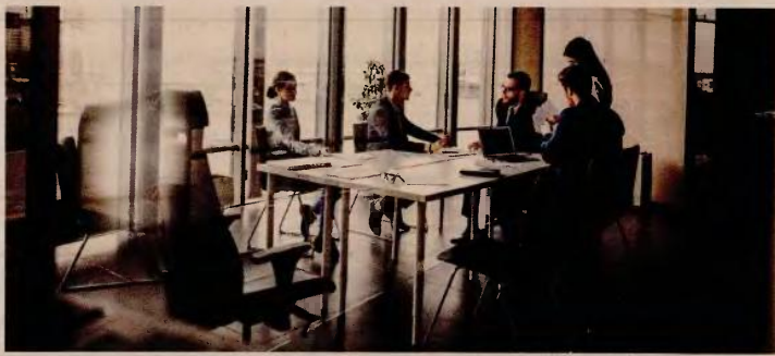
Στο συρτάρι του υπουργείου Εργασίας υπάρχει το σενάριο απαγόρευσης ασφάλισης στα επαγγελματικά ταμεία ατόμων άνω των 50 ή 55 ετών, γεγονός που θα οδηγήσει τη συντριπτική πλειοψηφία των εργαζομένων και των διευθυντικών τους στελεχών εκτός ασφάλισης ΤΕΑ και κατά συνέπεια θα αποτρέψει τη δημιουργία νέων.

Οι περισσότερες από τις προωθούμενες διατάξεις θεωρούνται θετικές για τον θεσμό, υπάρχουν όμως και κάποιες που ήδη έχουν προκαλέσει έντονες αντιδράσεις, όπως και διατάξεις που λόγω των αναταράξεων δεν έχουν «κλειδώσει» ακόμη. Για παράδειγμα, κύκλοι της αγοράς των ΤΕΑ αλλά και επιχειρηματίες και συνδικαλιστές εκπρόσωποι των εργαζομένων θεωρούν ανυπόστητη την ανάγκη δημιουργίας πολυεργοδοτικών ΤΕΑ, ή τη θέσπιση κανόνων χρηστής διακυβέρνησης, τη μεταφορά της εποπτείας σε έναν φορέα, και δη στην Τράπεζα της Ελλάδος αλλά και τη δυνατότητα επενδύσεων σε