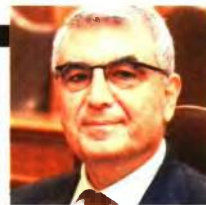
Πάνος Τσακλόγλου Υφυπουργός Εργασίας και Κοινωνικών Ασφαλίσεων

Πρόκειται να εκπονήσουμε ένα αναλυτικό και στοχευμένο Εθνικό Σχέδιο εντός του 2024 για το Δημογραφικό, με την ενεργή συμμετοχή της Κοινωνίας των Πολιτών και των φορέων της Τοπικής Αυτοδιοίκησης