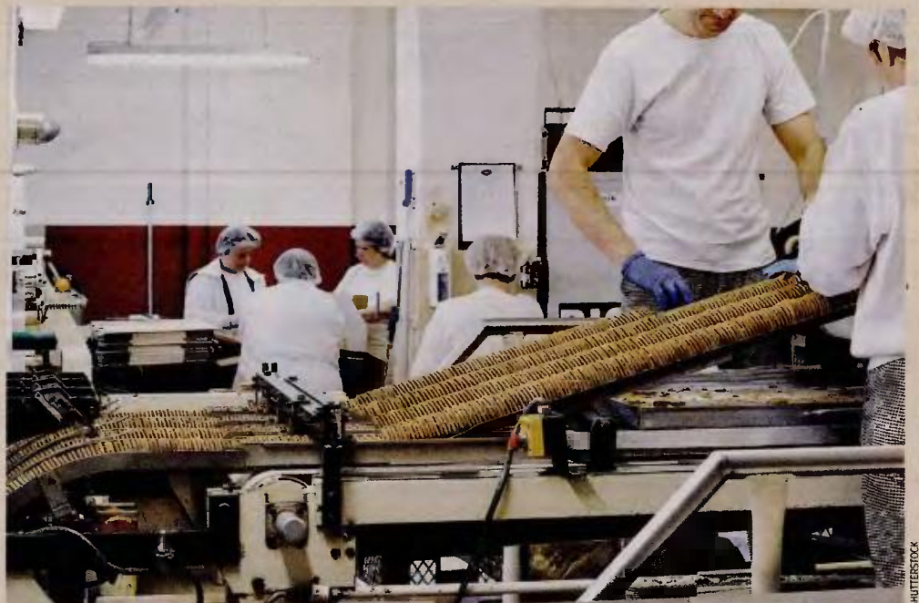
Η δυνατότητα των αναδρομικών αυξήσεων δεν προβλέπεται στην τροπολογία για τις τριετίες. Προκύπτει όμως εκ των πραγμάτων, καθώς οι συγκεκριμένοι εργαζόμενοι δικαιούνταν τις τριετίες τους, αλλά δεν τις πληρώνονταν.

Να σημειωθεί ότι η δυνατότητα αυτή δεν προβλέπεται στην τροπολογία για τις τριετίες. Προκύπτει όμως εκ των πραγμάτων, καθώς και όλο το προηγούμενο διάστημα οι εργαζόμενοι δικαιούνταν τις τριετίες τους αλλά δεν τις πληρώνονταν.