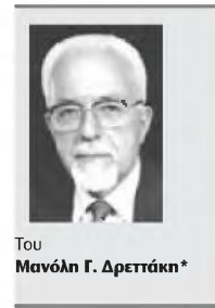
Του Μανώλη Γ. Δρεττάκη*

- Από τα παραπάνω φαίνεται ότι η αύξηση του πληθυσμού της Κρήτης οφείλεται περισσότερο στην αύξηση των ανδρών και γυναικών στο νομό Λασιθίου και λιγότερο στην αύξηση των γυναικών