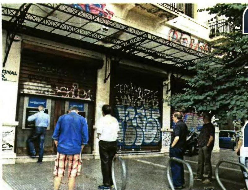
Περίπου 6.500 συνταξιούχοι θα πληρωθούν το εφάπαξ το τρίμηνο Σεπτέμβριος, Οκτώβριος, Νοέμβριος.

Μαζικές πληρωμές εφάπαξ με ποσά που φτάνουν ως και τις 97.087€ έρχονται μέχρι το τέλος της χρονιάς για περισσότερους από 23.300 εν αναμονή συνταξιούχους από 32 ταμεία πρόνοιας του δημοσίου και του ιδιωτικού τομέα. Τα νέα ποσά εφάπαξ που θα λάβουν οι εν αναμονή συνταξιούχοι αποκαλύπτει σήμερα ο «Ελεύθερος Τύπος» και, σύμφωνα με τον σχετικό πίνακα πληρωμών, διαμορφώνονται για τους συνταξιούχους των μεγαλύτερων Ταμείων ως εξής: ▶ Στις 24.540€ για τους συνταξιούχους δημοσίου υπαλλήλους, (ΤΠΔΥ). ▶ Στις 39.339€ για συνταξιούχους υπαλλήλους και λειτουργούς Ειδικών Μισθολογίων. ▶ Στις 37.122€ για συνταξιούχους ΟΤΕ. ▶ Στις 56.956€ για συνταξιούχους ΟΣΕ. ▶ Στις 21.793€ για συνταξιούχους αξιωματικούς του Εμπορικού Ναυτικού. ▶ Στις 25.037€ για συνταξιούχους Σωμάτων Ασφαλείας που λαμβάνουν διπλό εφάπαξ από ΤΠΔΥ και ΤΑΠΙΑΣΑ. ▶ Στις 26.359€ για συνταξιούχους εκπαιδευτικούς. ▶ Στις 24.923€ για συνταξιούχους ΔΕΗ. ▶ Στις 18.045€ για συνταξιούχους Δικηγόρους Αθηνών. ▶ Στις 30.634€ για συνταξιούχους συμβολαιογράφους. ▶ Στις 10.196€ για συνταξιούχους μηχανικούς. Χάσμα... Το μικρότερο εφάπαξ πληρώνει ο κλάδος πρόνοιας υγειονομικών (γιατροί, φαρμακοποιοί), με το μέσο ποσό μόλις στις 2.024€, ενώ το υψηλότερο εφάπαξ συναντάται στον ταμείο πρόνοιας των λιμενεργατών με το μέσο ποσό στις 97.087€. Η μεγάλη ψαλίδια