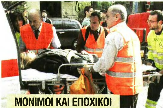
ΜΟΝΙΜΟΙ ΚΑΙ ΕΠΟΧΙΚΟΙ

Οι περισσότερες θέσεις αφορούν σε πλήρωματα ασθενοφόρων και διασώστες