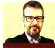
ΤΟΥ ΧΡΗΣΤΟΥ ΚΟΛΩΝΑ

Β ουτιά έως και 33% στα τιμολόγια ρεύματος για τον Αύγουστο έναντι του Ιουλίου καταγράφεται στις ανταγωνιστικές χρεώσεις που ανακοίνωσαν οι πάροχοι.