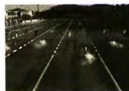
Άθλησης κολύμβησης σε Δημοτικό Κολυμβητήριο

Για ανηλίκους: Ιατρική βεβαίωση παιδιάτρου, όπου θα πρέπει να βεβαιώνεται - αντιγράφεται ότι το παιδί είναι καρδιολογικά και δερματολογικά υγιές για να συμμετέχει σε πρόγραμμα εκμά-