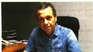
ΠΟΣΗ ΣΥΝΤΑΞΗ ΚΑΙ ΠΟΣΟ ΕΦΑΠΑΞ ΘΑ ΠΑΡΩ;

ΤΟ ΔΙΚΗΓΟΡΙΚΟ ΓΡΑΦΕΙΟ «ΜΑΡΓΑΡΙΤΑ Γ. ΚΑΡΔΑΡΗ» ΣΑΣ ΔΙΝΕΙ ΕΓΚΥΡΕΣ ΑΠΑΝΤΗΣΕΙΣ ΓΙΑ ΤΟ ΑΣΦΑΛΙΣΤΙΚΟ