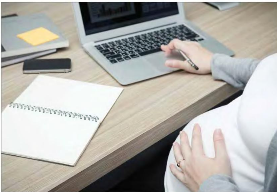
Η επιθυμία εκατοντάδων γυναικών να κάνουν οικογένεια στέκεται εμπόδιο στην προσπάθειά τους να βρουν δουλειά.

■ Εργασιακές αυθαιρέσιες και στο Ηράκλειο: Δεν τις προσλαμβάνουν για να γλιτώσουν άδειες μητρότητας και επιδόματα