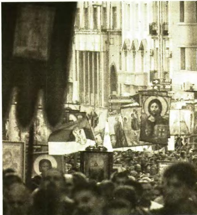
Γράφει ο Πέτρος Νικολού Δικηγόρος Αθηνών Νομική ΕΚΠΑ

τα, χωρίς καμμία δική μας αντικειμενική ευθύνη και αφ' ετέρου να φωτογραφηθούμε στα πολύχρωμα φεστιβάλ με τα ξόανα της ανωμαλίας, για να μάς χορηγηθεί έγκυρο πιστοποιητικό προσδοπληξίας. Το εκσυγχρονιστάν των γαλαζοαιμάτων πλήρως ευθυγραμμισμένο με τις οδηγίες της βρυξελλιώτικης ελτοκρατίας απαιτεί ανοιχτά λευκή επιταγή, για να προχωρήσει στο πλαίσιο μιάς βίαιας συ-