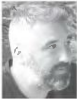
ΤΟΥ ΛΟΪΖΟΥ ΑΣΒΕΣΤΑ

Η χώρα και κυρίως η νέα κυβέρνηση που θα προκύψει από τις εκλογές της 25ης Ιουνίου, θα βρεθεί αντιμέτωπη με αρκετά προβλήματα, στα οποία πρέπει να βρει λύσεις.