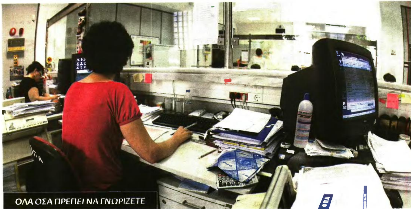
ΟΛΑ ΟΣΑ ΠΡΕΠΕΙ ΝΑ ΓΝΩΡΙΖΕΤΕ