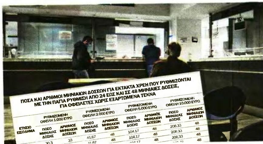
ΠΟΣΑ ΚΑΙ ΑΡΙΘΜΟΙ ΜΗΝΙΑΙΩΝ ΔΟΣΕΩΝ ΓΙΑ ΕΚΤΑΚΤΑ ΧΡΕΗ ΠΟΥ ΡΥΘΜΙΖΟΝΤΑΙ ΜΕ ΤΗΝ ΠΑΓΙΑ ΡΥΘΜΙΣΗ ΑΠΟ 24 ΕΩΣ ΚΑΙ ΣΕ 48 ΜΗΝΙΑΙΕΣ ΔΟΣΕΙΣ, ΓΙΑ ΟΦΕΙΛΕΤΕΣ ΧΩΡΙΣ ΕΞΑΡΤΩΜΕΝΑ ΤΕΚΝΑ