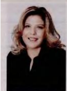
Της ΜΑΡΙΑΣ ΣΥΡΕΤΤΕΛΑ Βουλευτού ΝΔ, πρώην Υφυπουργού Εργασίας και Κοινωνικών Υποθέσεων

Την τελευταία τετραετία κάναμε σημαντικά βήματα προόδου στη στήριξη της οικογένειας και θα τα συνεχίσουμε και την επόμενη τετραετία. Η ΝΔ προστατεύει τους εργαζομένους, τους γονείς, τα νέα ζευγάρια και τους νέους και δημιουργεί τις προϋποθέσεις για αύξηση του εθνικού εισοδήματος και βελτίωση της ποιότητας ζωής των πολιτών, με πράξεις και όχι με λόγια του αέρα.