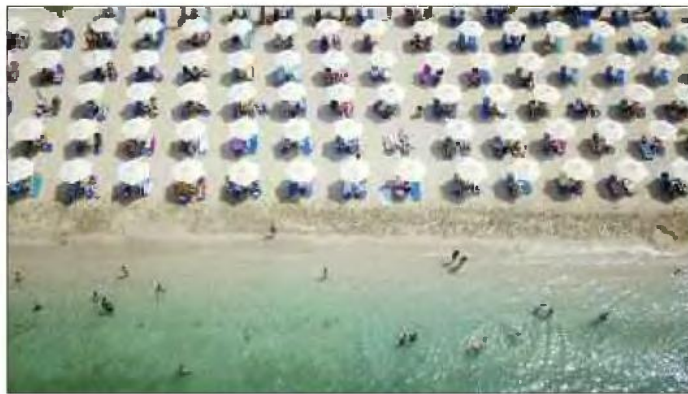
Η ώρα της... παραλίας πλησιάζει

Μπαίνοντας στην πλατφόρμα, θα σας ζητηθούν οι κωδικοί Taxinet και ο ΑΦΜ, ενώ θα χρειαστείτε ένα e-mail και έναν αριθμό κινητού τηλεφώνου. Πώς κάνετε αίτηση βήμα-βήμα: • Καταχωρίζετε τα στοιχεία επικοινωνίας και, ειδικότερα, το e-mail και τον αριθμό του κινητού τηλεφώνου τα οποία, στη συνέχεια, πιστοποιείτε. • Δηλώνετε ότι δεν έχετε επιλεγεί ως δικαιούχος - ωφελούμενος στο πλαίσιο άλλου προγράμματος κοινωνικού τουρισμού ή προγράμματος τος ενίσχυ-