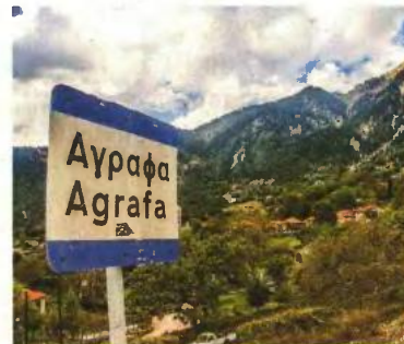
Η έλλειψη υποδομών είναι σαφώς ένας από τους παράγοντες που αναγκάζει τους πολίτες να φύγουν από τα Αγραφα

πρωτιά: το ποσοστό ανεργίας στους τέσσερις νομούς της - Κοζάνης, Γρεβενών, Καστοριάς, Φλώρινας - φτάνει το 19,8%, το μεγαλύτερο στην Ελλάδα. «Άλλη μία περιοχή της Ελλάδας που εκπέμπει SOS. Άλλη μία περιοχή της Ελλάδας που ζητά κίνητρα προκειμένου να μην ερημώσει». Παρά τις αντιξοότητες και τους αριθμούς που «δείχνουν» ένα μέλλον δυσόιο, ο περιφερειάρχης Γιώργος Κασαπίδης προτιμά να διατηρεί την αισιοδοξία του. Όπως λέει, «οι τρεις πυλώνες του Αναπτυξιακού Προγράμματος Δίκαιης Μετάβασης, που θα ενισχύσουν ιδιωτικές επενδύσεις και δημόσια έργα, θα αποτελέσουν ένα ισχυρό κίνητρο για τους νέους προκειμένου να επιστρέψουν στον τόπο τους και να του δώσουν ξανά ζωή».