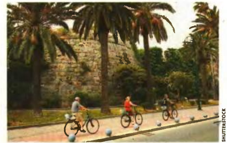
Στην Κω η αύξηση του πληθυσμού άγγιξε το 10,6% συγκριτικά με την απογραφή του 2011, σύμφωνα με την ΕΛΣΤΑΤ