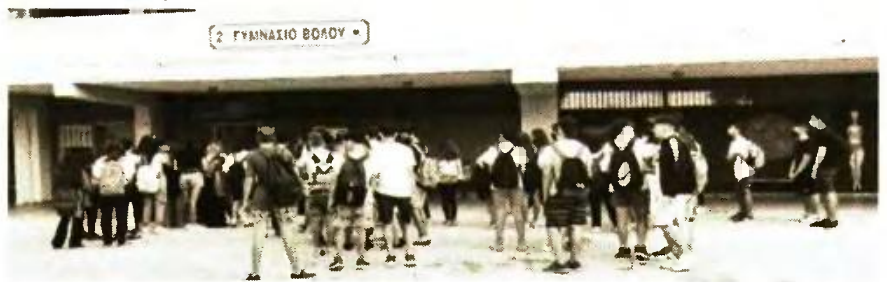
Μειωμένος αριθμός μαθητών αναμένεται να φοιτήσει στην α' γυμνασίου από το νέο σχολικό έτος

Από την τοπική διεύθυνση βεβαίως στόχος είναι να