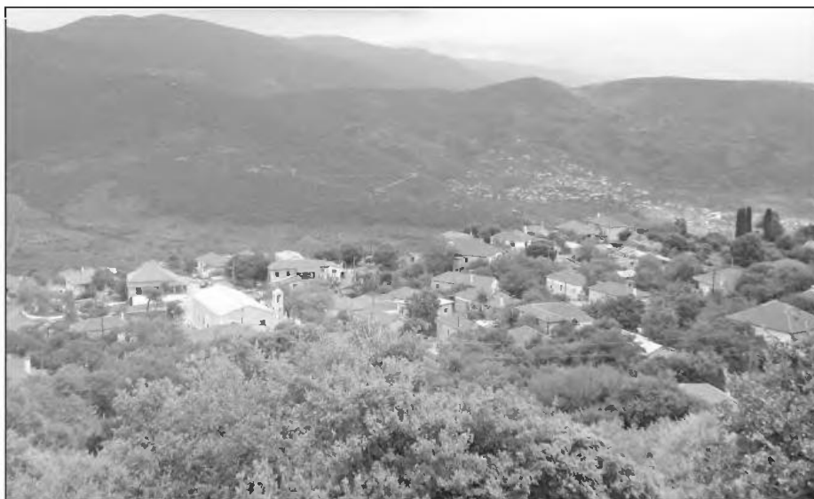
Ανάυση: Θανάσης Λαγός

αυξήθηκε στις Κοινότητες Καλυβίων, Αμπελιώνας και Άνω Δωριού. Συνολικά στο Δήμο Οιχαλίας ο πληθυσμός μειώθηκε 24,6%, από 11.228 σε 8.504 κατοίκους.