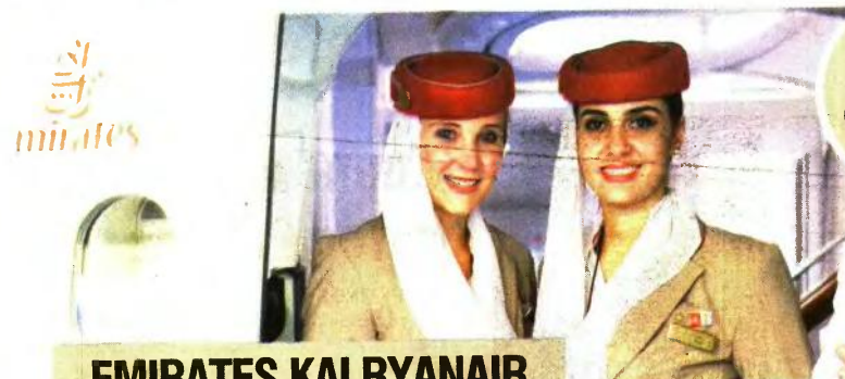
EMIRATES KAI RYANAIR