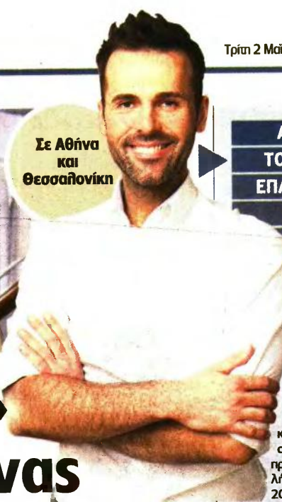
Σε Αθήνα και Θεσσαλονίκη

ΑΙΤΗΣΕΙΣ ΓΙΑ ΤΟ ΠΡΟΓΡΑΜΜΑ ΕΠΑΓΓΕΛΜΑΤΙΚΗΣ ΕΜΠΕΙΡΙΑΣ ΓΙΑ 3.900 ΑΝΕΡΓΩΝ