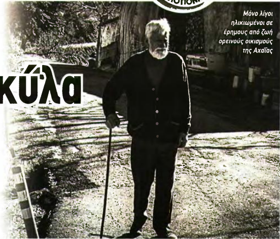
Μόνο λίγοι ηλικιωμένοι σε έρημους από ζωή ορεινούς οικισμούς της Αχαΐας

Ανυποχνηκιά είναι τα στοιχεία, που παρουσίασε η Ελληνική Στατιστική Αρχή, για τον μόνιμο πληθυσμό της Αχαΐας, από την απογραφή του 2021, καθώς η περιοχά ακολουθεί τη γενική τάση της χώρας με μείωση των κατοίκων.