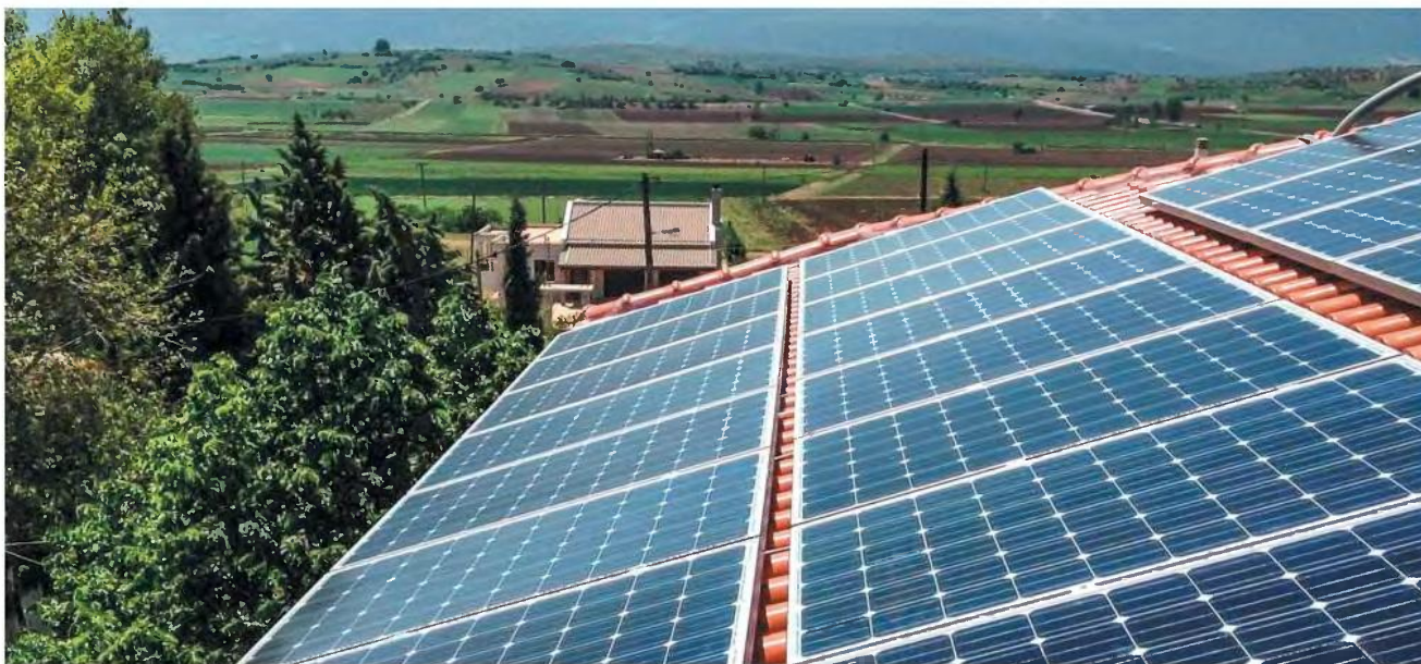
ΦΩΤΟΒΟΛΤΑΪΚΑ ΣΤΗ ΣΤΕΓΗ