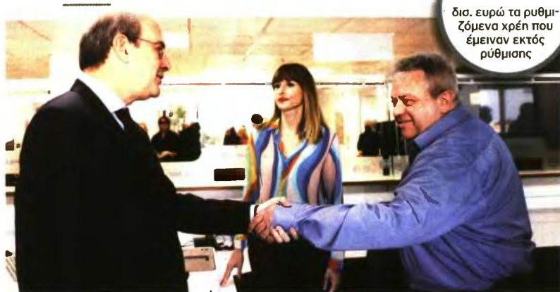
* Ο υπουργός Εργασίας, Κωστής Χατζηδάκης, σε υποκατάστημα του ΕΦΚΑ

Για την υπαγωγή εκ νέου στη ρύθμιση απαιτείται η υποβολή του σχετικού αιτήματος στις ηλεκτρονικές υπηρεσίες του ΚΕΑΟ έως την 31η Ιουλίου 2023. Αυτοί οι οφειλέτες, εφόσον έχουν νεότερες οφειλές, θα πρέπει να ενταχθούν και στη ρύθμιση των 24 δόσεων.