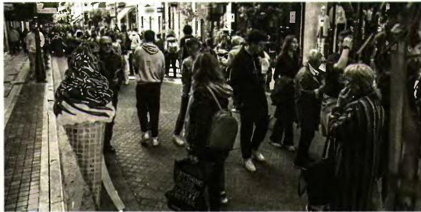
Ο αχαϊκή πρωτεύουσα εμφανίζεται ενισχυμένη με πληθυσμό 215.922 κατοίκους

Αναφορικά με τους δήμους που αποτελούν πρωτεύουσες Περιφερειακών Ενοτήτων, οι 24 κατέγραψαν αύξηση, μεταξύ αυτών και η Πάτρα. Το αστικό συγκρότημα σημείωσε αύξηση πληθυσμού, από 171.075 άτομα στην απογραφή