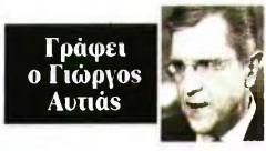
Γράφει ο Γιώργος Αυτιάς

Οι ασφαλισμένοι του τ. ΟΓΑ, πότε θεμελιώνουν δικαίωμα και με ποιους όρους