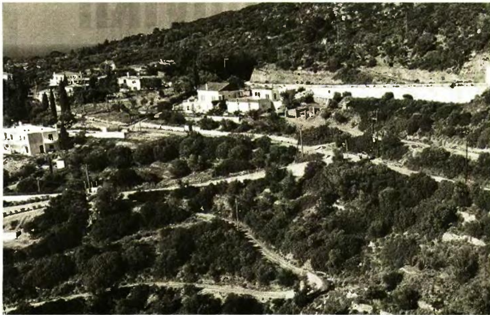
Μέχρι τη Μεγάλη Τετάρτη θα πάει προς ψήφιση στη Βουλή η νέα ρύθμιση για δόμηση εκτός σχεδίου.