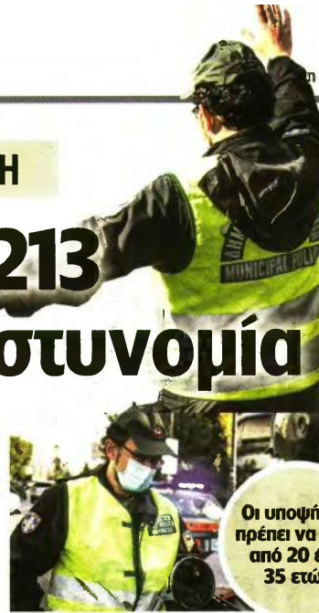
Οι υποψήφιοι πρέπει να είναι από 20 έως 35 ετών

τον περσινό Σεπτέμβριο στο πλαίσιο του ετήσιου προγραμματισμού προσλήψεων. Να σημειώσουμε ότι είναι η πρώτη φορά που οι προσλήψεις στη Δημοτική Αστυνομία θα πραγματοποιηθούν εξολοκλήρου μέσω ΑΣΕΠ. Στον Δήμο Αθηναίων κατανέμονται 181 θέσεις, από τις οποίες οι 153 είναι κατηγορίας ΔΕ, και από 14 θέσεις στις κατηγορίες ΠΕ και ΤΕ. ■