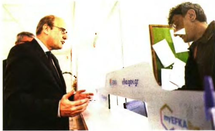
* Στιγμιότυπο από επίσκεψη του υπουργού Εργασίας και Κοινωνικών Υποθέσεων, Κωστή Χατζηδάκη, σε υποκατάστημα ΕΦΚΑ στην Αγ. Παρασκευή