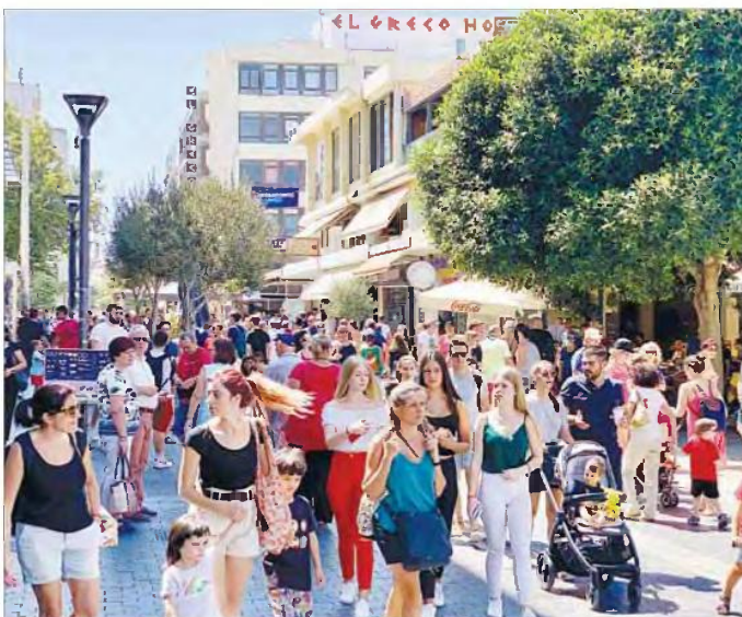
Ο μόνιμος πληθυσμός της Κρήτης, σύμφωνα με τα επίσημα στοιχεία της Ελληνικής Στατιστικής Αρχής, ανέρχεται σε 624.408, εκ των οποίων οι 308.608 είναι άνδρες και οι 315.800 είναι γυναίκες.

«Υπάρχει μια ανισομερία. Ο αριθμός κινείται προς τα πάνω. Στους αριθμούς αυτούς υπάρχουν και άλλα δεδομένα, όπως αλλοδαποί και μεικτοί γάμοι, που τώνουν τον πληθυσμό. Η Κρήτη είναι ενεργή. Έχει σημαντικό πληθυσμό. Και θεωρώ πως έχουμε βάσιμες ελπίδες να ελπίσουμε με τρόπο αισιόδοχο εάν αναλογιστούμε σημαντικά αναπτυξιακά έργα, όπως είναι ο ΒΟΑΚ και η τουριστική ανάπτυξη που έχουμε», τόνισε.