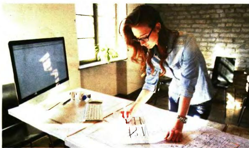
Αναβίωση των ευνοϊκών ρυθμίσεων για χρέη που βαρύνουν εργοδότες, αυτοαπασχολούμενους και ελεύθερους επαγγελματίες.

Σύμφωνα με τις οδηγίες που εξέδωσε χτες το ΚΕΑΟ με σχετική του εγκύκλιο, προκειμένου να αναβιώσουν οι ρυθμίσεις των 120 και 72 δόσεων, θα πρέπει