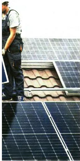
ρόνο από λογαριασμούς ρεύματος.