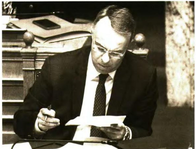
* Ο υπουργός Οικονομικών, Χρήστος Σταϊκούρας, κατά τη συζήτηση του πολυνομοσχεδίου στη Βουλή

θα του επιβληθεί, προβλέπεται σε τροπολογία του υπουργείου Οικονομικών. Η έκπτωση δεν θα αφορά τα νομικά πρόσωπα, παρά μόνο τα φυσικά, ενώ η εξόφληση θα πρέπει να γίνει μέχρι τις 31 Ιουλίου. Αν τώρα κάποιος αποφασίσει να πληρώσει με δόσεις, αυτές θα μπορούν να είναι μέχρι οκτώ, με πρώτη πληρωμή το αργότερο έως την 31η Ιουλίου και ολοκλήρωση των καταβολών την 29η Φεβρουαρίου του επόμενου (δισεκτου) έτους. Ειδικά σε ό,τι αφορά δηλώσεις φορολογουμένων που συμμετέχουν σε νομικά πρόσωπα που τηρούν απολογαφικά βιβλία, η αποπληρωμή γίνεται σε έξι δόσεις, ξεκινώντας από τον Σεπτέμβριο με ολοκλήρωση και