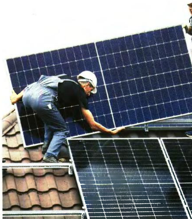
Με «Φωτοβολταϊκά στη Στέγη» μπορεί να εξοικονομηθούν έως 3.000€ το

Ο φωτοβολταϊκός σταθμός μπορεί να τοποθετηθεί στη στέγη ή το δώμα κτιρίου (στα οποία συμπεριλαμβάνονται και στέγαστρα, βεράντες, προσόψεις, σκιάστρα και πέργκολες), σε βοηθητικούς χώρους του κτιρίου ή της