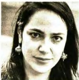
* Η υφυπουργός Εργασίας, Δόμνα Μιχαηλίδου

Ξεκινά για πρώτη φορά στην χώρα μας η υλοποίηση του θεσμού της Ημιαυτόνομης Διαβίωσης, αρχικά για 400 εφήβους που φιλοξενούνται χρόνια σε ιδρύματα, με στόχο την ομαλή ένταξή τους στο κοινωνικό σύνολο. Όπως, όμως, έχει διαπιστωθεί στα δύο χρόνια λειτουργίας του συστήματος Αναδοχής-Υιοθεσίας, υπάρχει μια δυσκολία στην τοποθέτηση σε οικογένειες τόσο των παιδιών με αναπηρία όσο και των παιδιών άνω των 15 ετών.